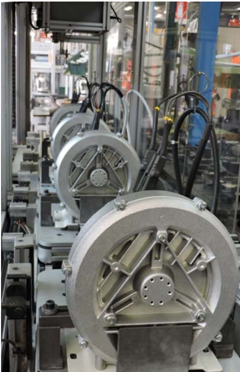
Soffianti Uni-Jet 75 in tunnel di collaudo.

Di seguito Vi mostriamo le foto di macchine in montaggio in linea ed in collaudo